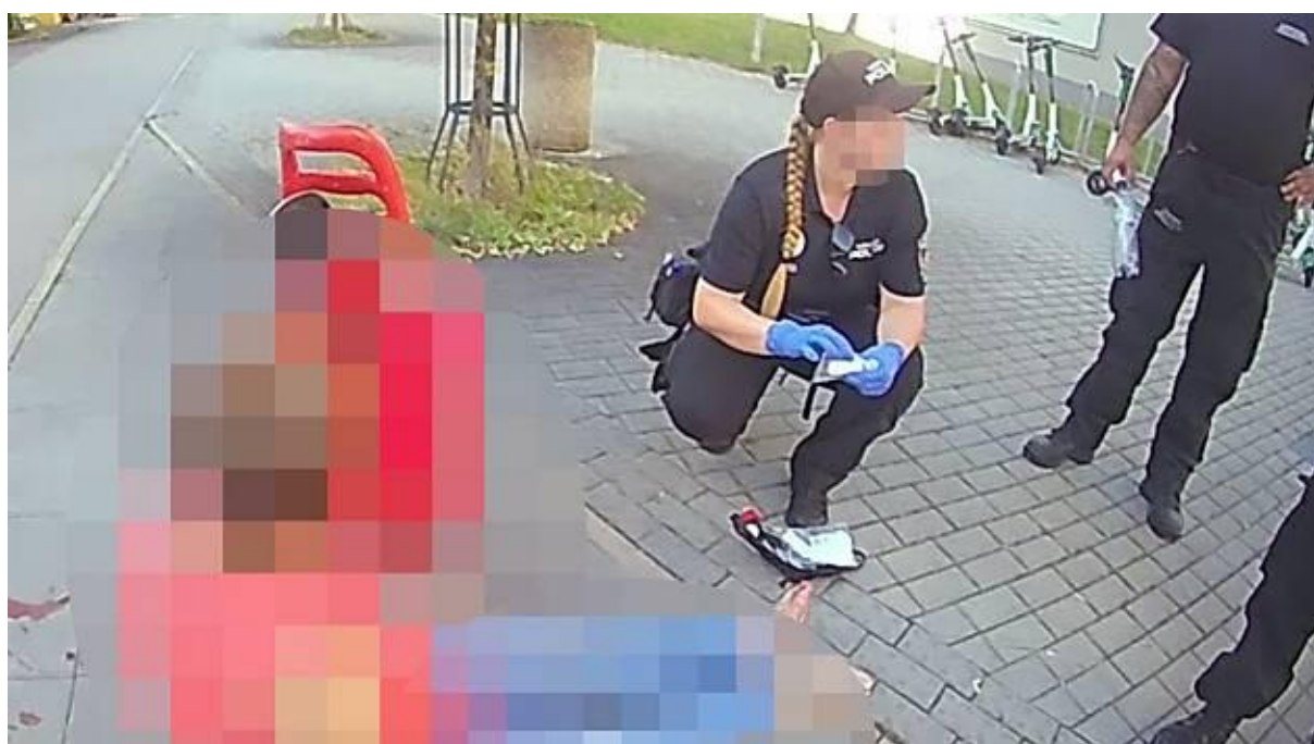
Zásah u zraněné ženy na budějovickém sídlišti Máj.

V úterý 12. srpna v půl šesté odpoledne kontrolovala hlídka asistentů prevence kriminality budějovického sídliště Máj.