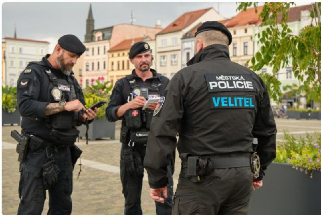
Nově zavedené označení „VELITEL“ na uniformě městské policie.

Velitel směny je vždy funkčně nadřízený vedoucí oddělení, který přímo v terénu velí a koordinuje zákroky strážníků. V krizových situacích může být jeho role klíčová, zejména pokud dorazí na místo události jako první ze všech složek integrovaného záchranného systému. Nové označení už mohou občané potkávat v ulicích města.