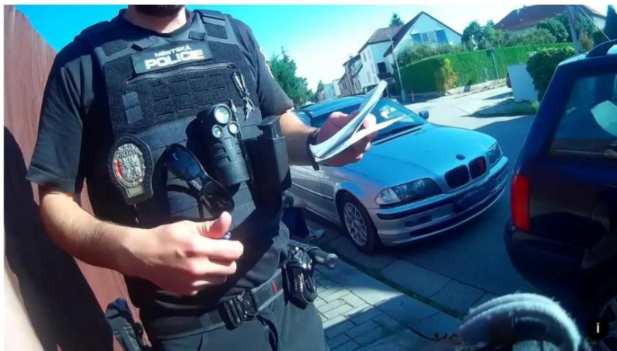
Českobudějovičtí strážníci řešili případ muže, který řídil bez oprávnění (ilustrační foto).

Bez řidičského průkazu sedl v neděli za volant škodovky a se třemi spolujezdci vyrazil do centra Českých Budějovic. Tam na sebe ale upozornil strážníky, když před jejich autem začal nesmyslně couvat. Vymlouval se pak sice, že za volantem neseděl, tři spolujezdci ale potvrdili, že řídil.