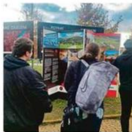
Aby nebyly vidět Studenti fotografie spolku zakryli bannery o první světové válce.

Toto a podobná prohlášení vyvolávala na místě stále napjatější at-