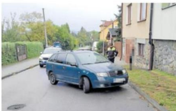
ŠPATNÝ DEN měl prý řidič, na kterého narazili strážníci v Nových Hodějovicích.

Strážníci se dezorientovaného muže dotázali, zda požil alkohol nebo jiné návykové látky, protože jeho stav tomu zcela odpovídal. Ten přiznal pouze užití několika léků. Orientační dechová zkouška