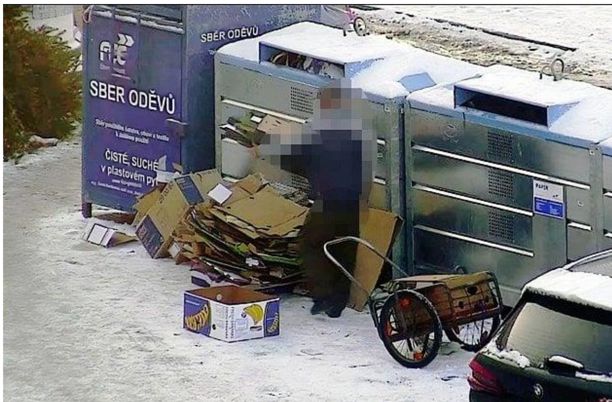
Okno městské kamery v Budějovicích například zachytilo muže, který k popelnicím přivážel odpad ve velkém.

„Příkladem může být případ z pondělí 22. ledna. Díky bystrému oku městské kamery se strážníkům podařil záchyt muže, který přivážel odpad ke kontejnerům opakovaně a ve velkém. Jak se ukázalo, muž si odvážel na ručním vozíku velké množství papírových kartonů. Strážníkům se svěřil, že je získal v prodejně zeleniny v centru města. Kam však odpad složí, to už bylo na něm. A když nebylo kam, velkou hlavu si s řešením nedělal. Případem se bude dále zabývat příslušný správní orgán,“ přiblížila Věra Šolková a doplnila, že za přestupek podle zákona o odpadech hrozí pachateli pokuta příkazem na místě do 10 tisíc korun, správní orgán však může uložit pokutu až 50 tisíc korun.