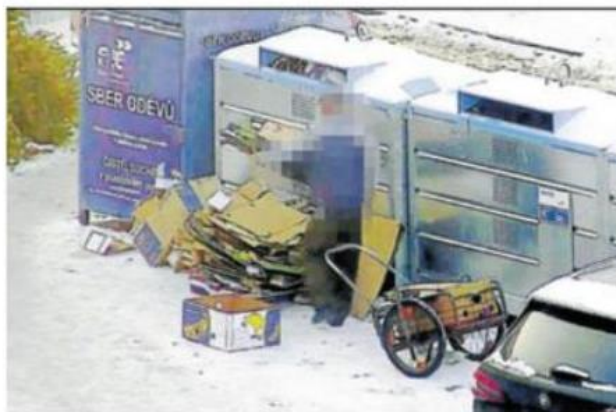
OKO městské kamery v Budějovicích zachytilo muže, který k popelnicím přivážel odpad ve velkém.

„Příkladem může být případ z pondělí 22. ledna. Díky bystrému oku městské kamery se strážníkům podařilo zachytit muže, který přivážel odpad ke kontejnerům opakovaně a ve velkém. Jak se ukázalo, muž si odvážel na ručním vozíku velké množství papírových kartonů. Strážníkům se svěřil, že je získal v prodejně zeleniny v centru města. Kam však odpad složí, to už bylo na něm. A když nebylo kam, velkou hlavu si s řešením nedělal. Případem se bude dále zabývat příslušný správní orgán,“ řekla Věra Školková a doplnila, že za přešůpek podle zákona o odpadech hrozí pachateli pokuta příkazem na místě do 10 tisíc korun, správní orgán