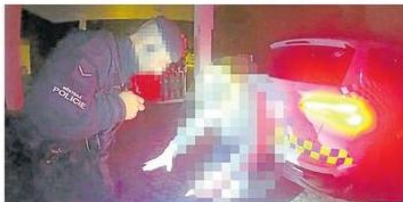
ZÁSAH. Muže podezřelého z vloupání chytily českobudějovičtí strážníci v neděli 3. srpna.

Mluvčí strážníků uvedla, že na oznámení o muži, který