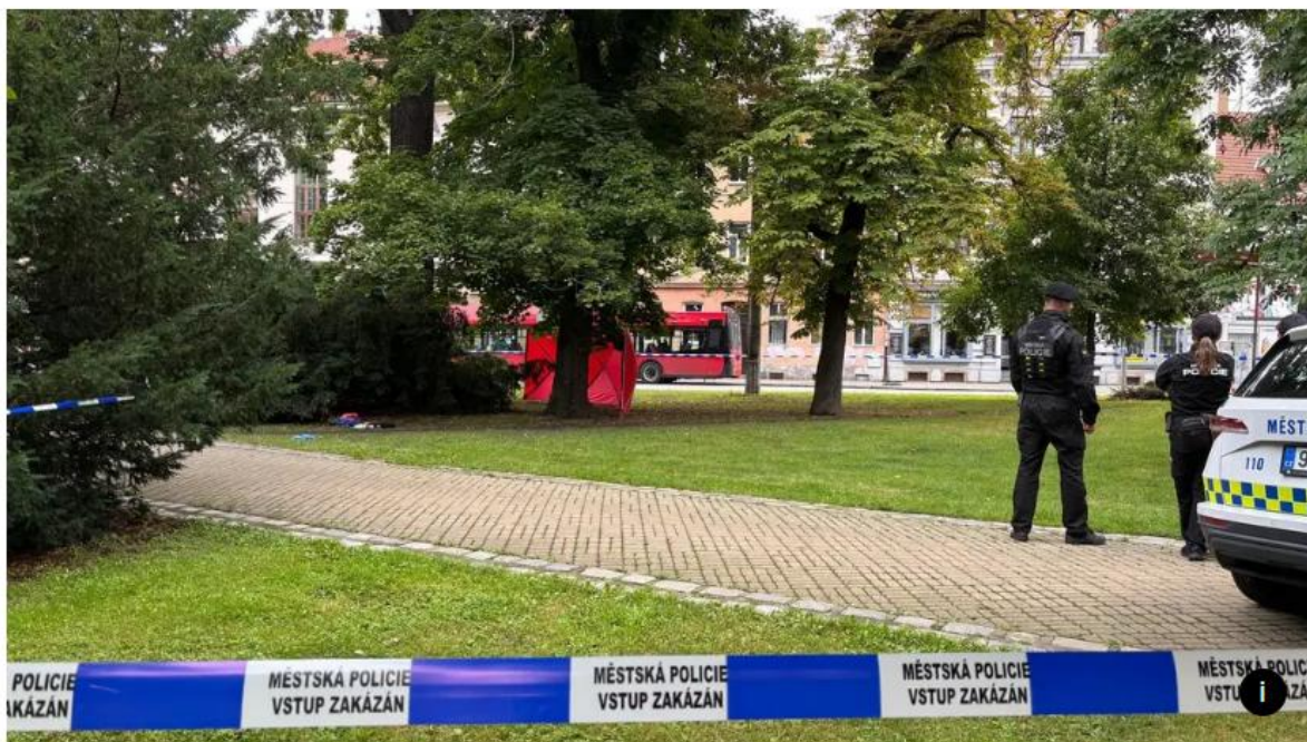
Policisté na místě nálezu mrtvého těla v parku Na Sadech

Při hlídce narazili v úterý ráno strážníci na mrtvolu 51letého muže. Ležel v parku Na Sadech v centru Českých Budějovic. Podle informací Novinek se jednalo o muže bez domova a případem se nadále zabývají policisté.