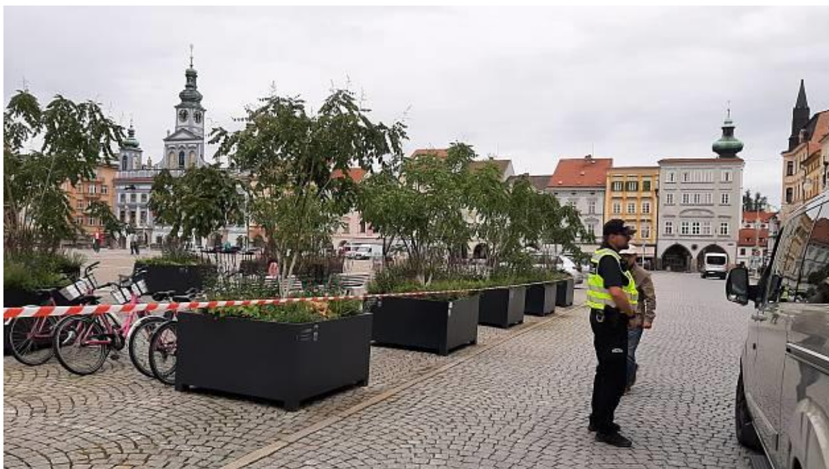
Na náměstí bude cíl Eurorally.

Sto padesát sportovních vozů projede v úterý v 16 hodin centrem Budějovic.