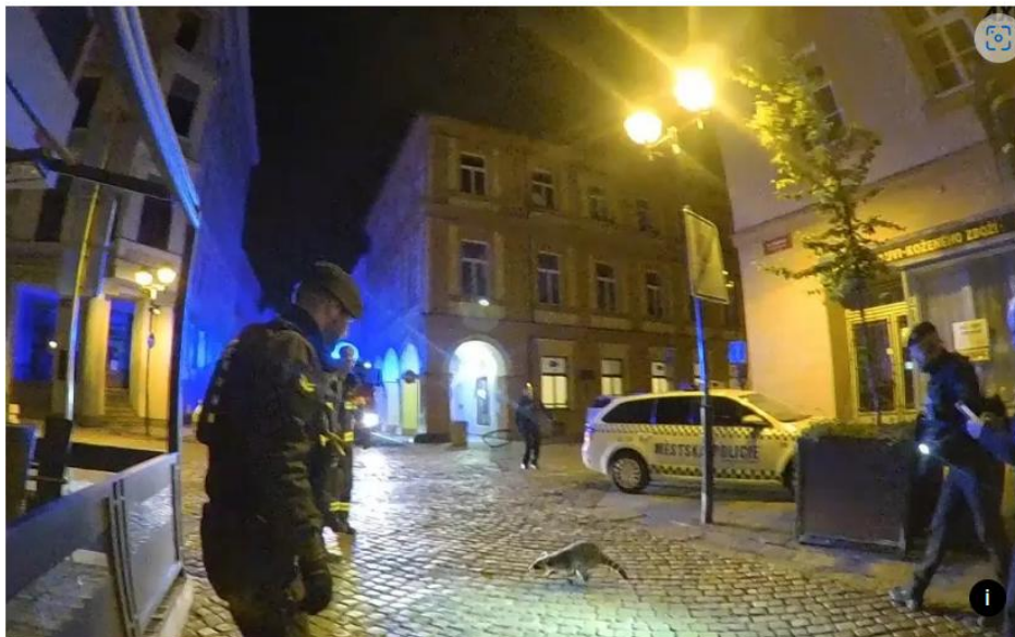
Mýval prchá před strážníky do tmy.