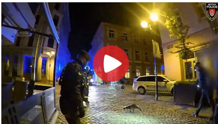
Strážníci naháněli v centru Budějovic mývala | (0:16) | video: MP ČB

Manévry strážníků a hasičů spustil v noci na dnešek mýval, který pobíhal po ulici v Českých Budějovicích. Protože se dostal vysoko na okenní parapet, museli strážníci povolat hasiče se žebříkem. Když však ke zvířeti vystoupali, skočil mýval přes kapotu služebního vozu dolů a zmizel.