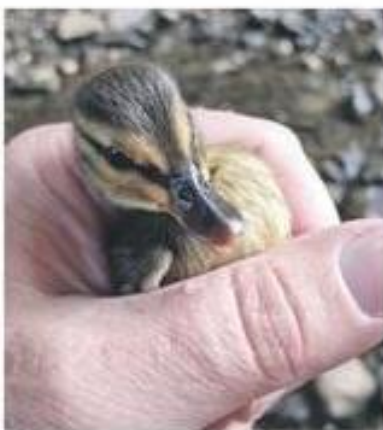
Kachňata zachránili strážníci.

„Ti poklop odstranili a uvězněná mláďata vysvobodili. Nejevila žádné známky zranění,