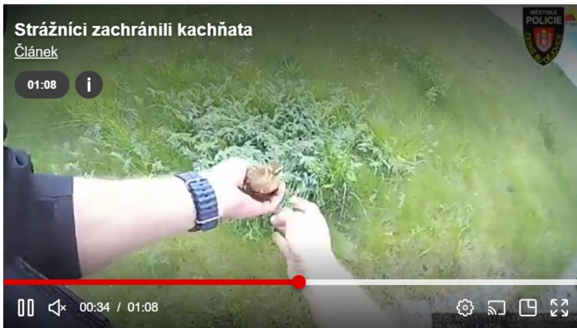
Strážníci zachránili kachňata Video: MP České Budějovice

Šest kachňat spadlo před několika dny v Českých Budějovicích do hluboké odpadní šachty při přesunu od rybníka k rybníku na sídlišti Máj. Informovali o tom místní strážníci, kteří mládřata z pasti pomáhali zachránit.