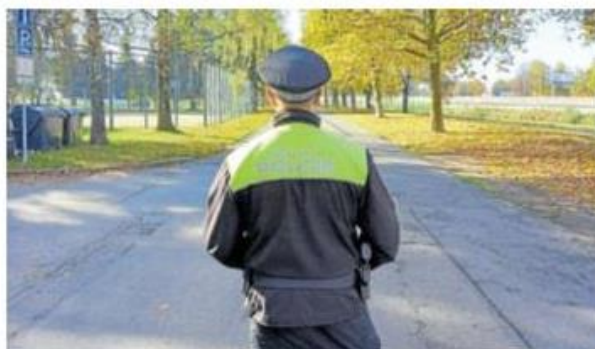
MĚSTSKÁ POLICIE v Českých Budějovicích.

pošty společného se strážníky? To městská policie představuje v několika bodech: Uniformu. Tu znáte, u nás dostanete zajímavé doplňky. Dámy i slušivý klobouček. Místní znalost. Je základním předpokladem pro práci strážníka v ulicích města. A vy už ji máte! Chůze nebo jízda na kole. U nás je to stejné, buď můžete vyrazit do ulic pěšky nebo na služebních kolech. Brašny. Také je máme, ale lehčí, než jsou poštovní brašny plné novin a dopisů. Schránka. Také nám chodí pošta. Občané do ní občas ukládají i nalezené doklady či jiné drobné nálezy.