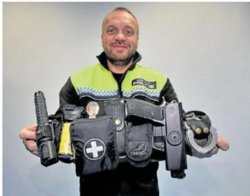
DO VÝBAVY strážníka českobudějovické městské policie patří teleskopický obušek, slzný plyn, lékárníčka, náhradní zásobník, rukavice, pistole a pouta.

Jaký je příběh vítězného videa? Páteční večer na náměstí Přemysla Otakara II v samém centru města. „Kamera připevněná na uniformě strážníka zachycuje, jak k vozu jeho hlídky přibíhá rozrušená skupina lidí. Muž s nožem ohrožuje kolemjdoucí! Strážníci na nic nečekají a kamera sleduje jejich rychlý postup k podezřelému. Ten na opakované výzvy k odložení zbraně nereaguje, místo toho se zbrani ohání i proti hlídce, jeho trhané pohyby svědčí o možném vlivu alkoholu či drog. Kvůli lidem okolo nelze použít střelnou zbraň, a tak se