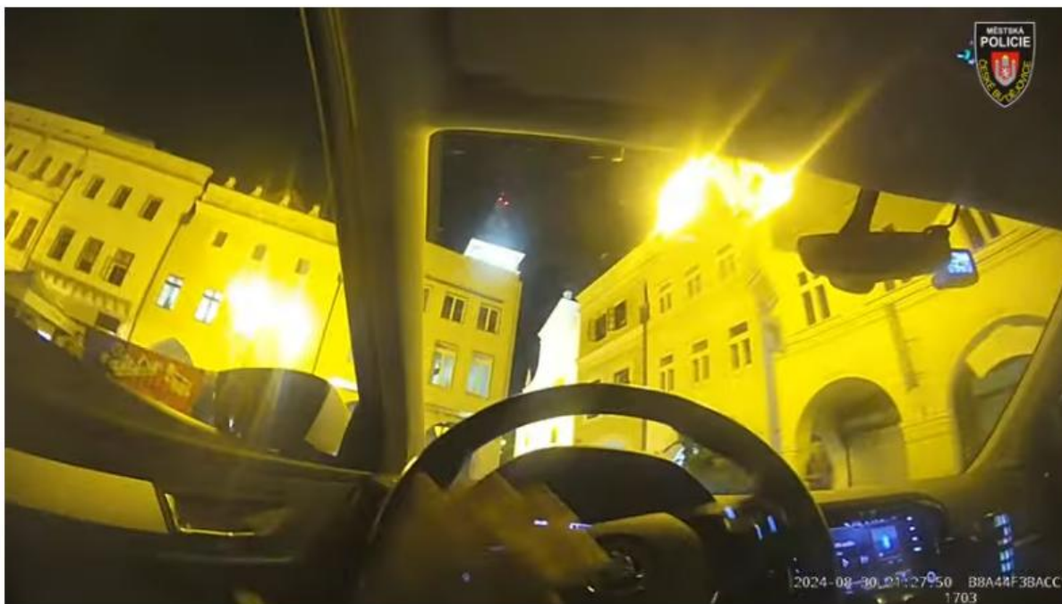
Zásah proti muži ozbrojeného nožem